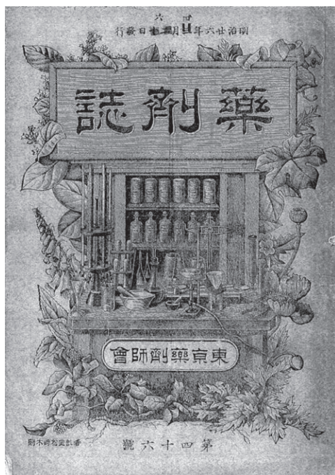
図1 『薬剤誌』第46号（明治26年3月20日改め4月6日発行）表紙（金沢大学附属図書館医学図書館所蔵）

などの薬草と薬品棚，調剤器具等が描かれており，下方中央に東京薬剤師会の文字，左下に木版画の印刷所名が表示されている。発行年月日は明治26年3月20日と印刷してあるが，その上に4月6日との訂正がなされている。