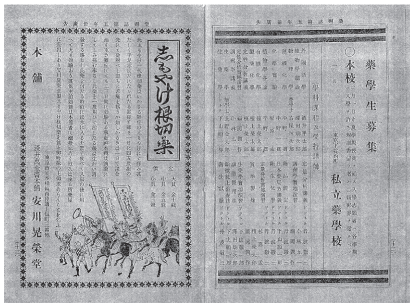
図4 『薬剤誌』第46号（明治26年3月20日付）広告